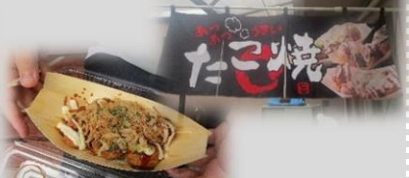
6/25 たこ焼きキッチンカー