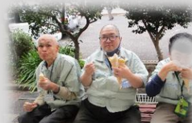
4/7 クレープキッチンカー