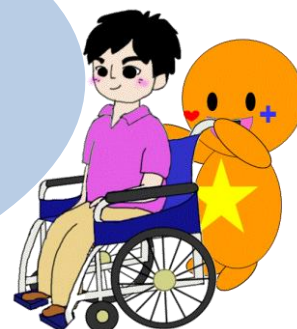
友愛十字会キャラクター ゆうあいくん